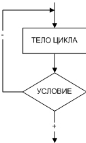
Рисунок 66. Алгоритм циклической структуры с постусловием

При написании условных циклических алгоритмов следует помнить следующее. Во-первых, чтобы цикл имел шанс когда-нибудь закончиться, содержимое его тела должно обязательно влиять на условие цикла. Во-вторых, условие должно состоять из корректных выражений и значений, определенных еще до первого выполнения тела цикла.